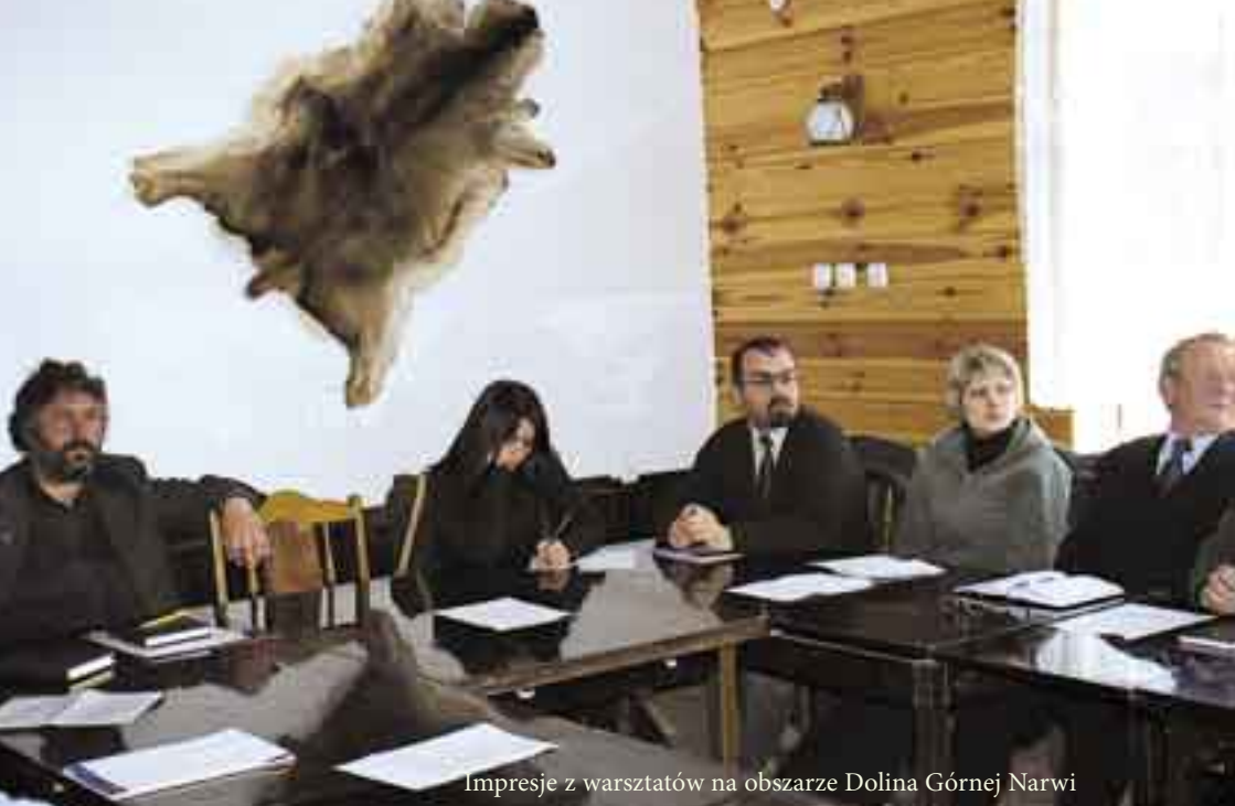
Impresje z warsztatów na obszarze Dolina Górnej Narwi