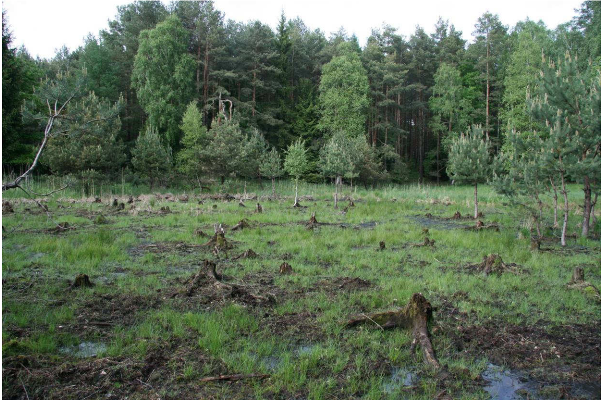
Torfowisko „Oswiec Eksperymentalny” - Nadleśnictwo Głusko 226g, z którego usunięto tawułę kutnerową. Zalane wodą, nie wymaga usuwania murszu.