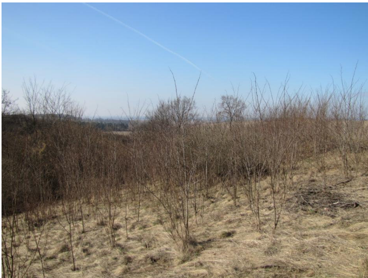
Powierzchnia przeznaczona do odtwarzania

Projekt i zakupy finansowane ze środków Narodowego Funduszu Ochrony Środowiska i Gospodarki Wodnej oraz unijnego instrumentu finansowania LIFE+