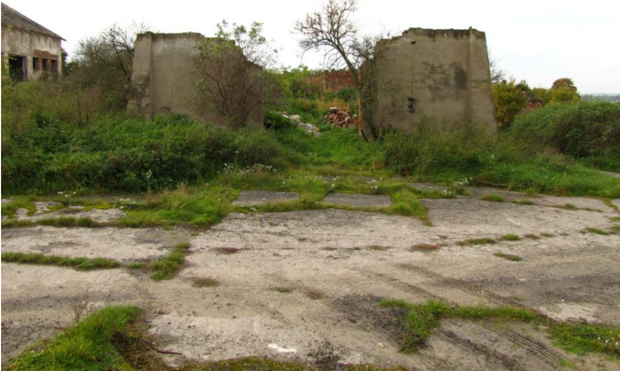
Powierzchnia przeznaczona do odtwarzania

Opis warunków terenowych: teren płaski lub lekko pochyły, podłoże piaszczysto-gliniaste.