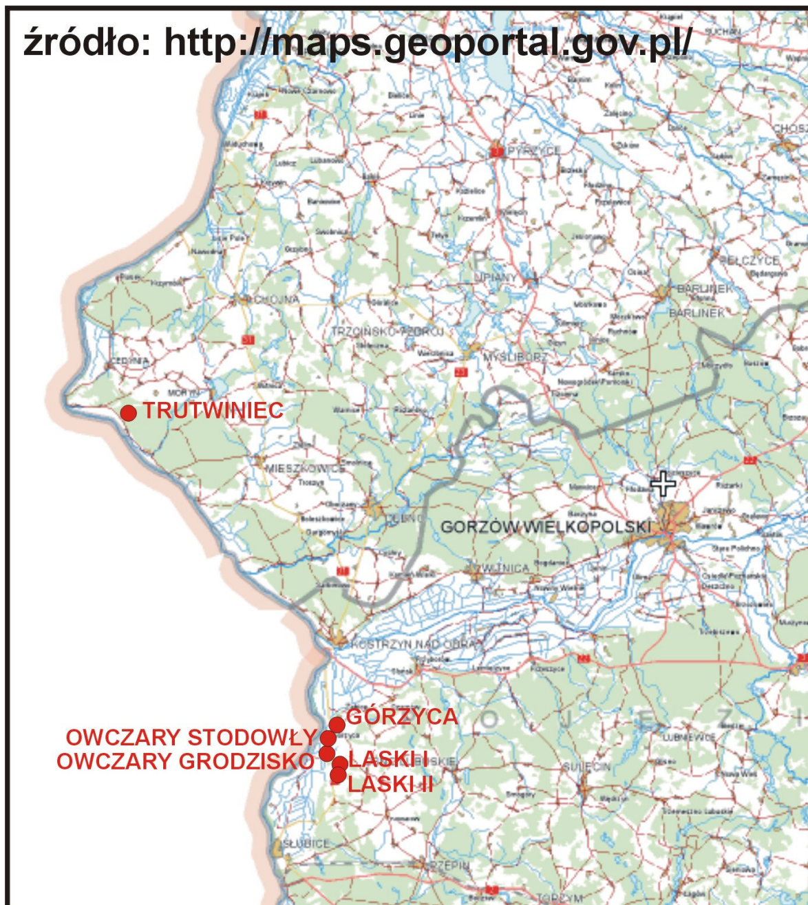
Ogólna lokalizacja powierzchni