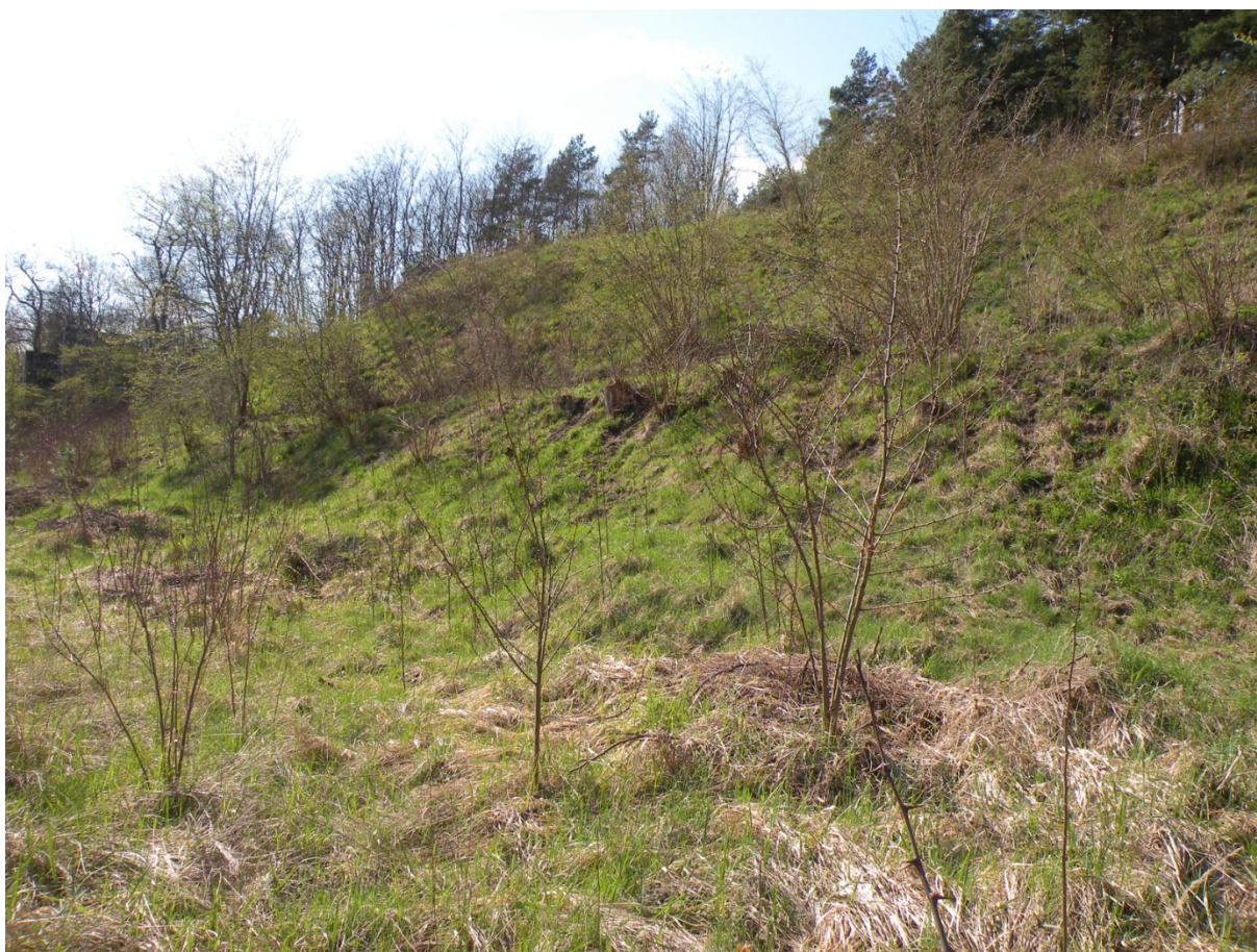
Powierzchnia przeznaczona do odtwarzania

TRUTWINIEC (RDLP Szczecin, nadleśnictwo Mieszkowice, leśnictwo Siekierki, pododdział 72 c) - odtwarzanie murawy kserotermicznej na powierzchni 0,3 ha poprzez zdarcie wierzchniej warstwy gleby na głębokość 0,4 m wraz z usunięciem pojedynczych drzew i krzewów oraz karp ściętych drzew i krzewów. Wycięcie samosiewu robinii akacjowej z terenu przyległego o powierzchni 0,2 ha (wiek drzewostanu – ok. 20 lat). Wyrównanie i uprzątnięcie powierzchni po zdarcie gleby i wyrwaniu karp. Przygotowanie i złożenie ściętego drewna w sortymencie wg zaleceń miejscowego leśniczego. Pozostały materiał pozyskany podczas prac (ścięte krzewy, karp, gałęzie, zdarta gleba, darń, ściółka itp.) należy wywieźć poza teren wykonywanych prac i zagospodarować we własnym zakresie. Za zagospodarowanie materiału odpowiada Zleceniobiorca. Opis warunków terenowych: teren położony na stromej skarpie (ok. 45°), podłoże piaszczysto-żwirowe.