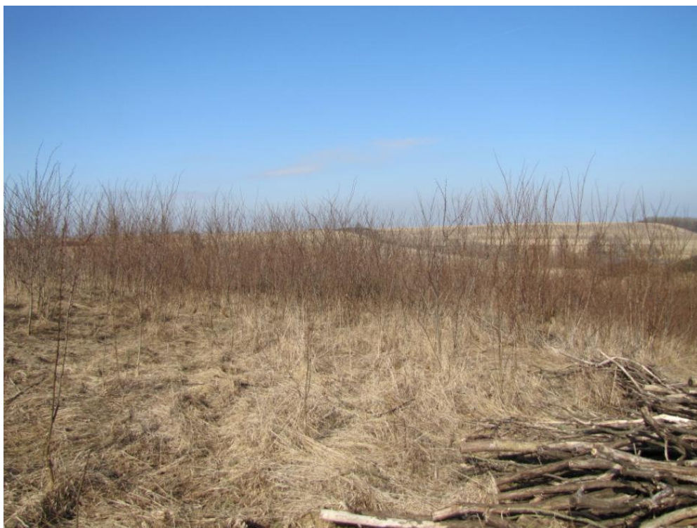
Powierzchnia przeznaczona do odtwarzania

Projekt i zakupy finansowane ze środków Narodowego Funduszu Ochrony Środowiska i Gospodarki Wodnej oraz unijnego instrumentu finansowania LIFE+