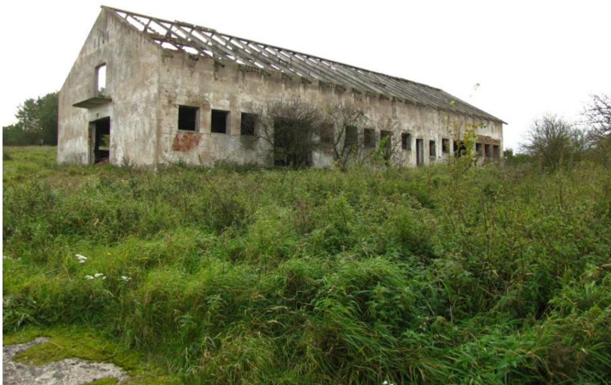
Powierzchnia przeznaczona do odtwarzania

Projekt i zakupy finansowane ze środków Narodowego Funduszu Ochrony Środowiska i Gospodarki Wodnej oraz unijnego instrumentu finansowania LIFE+