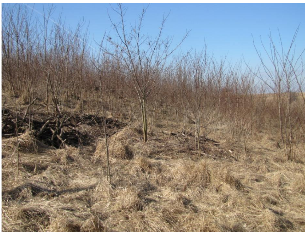
Powierzchnia przeznaczona do odtwarzania