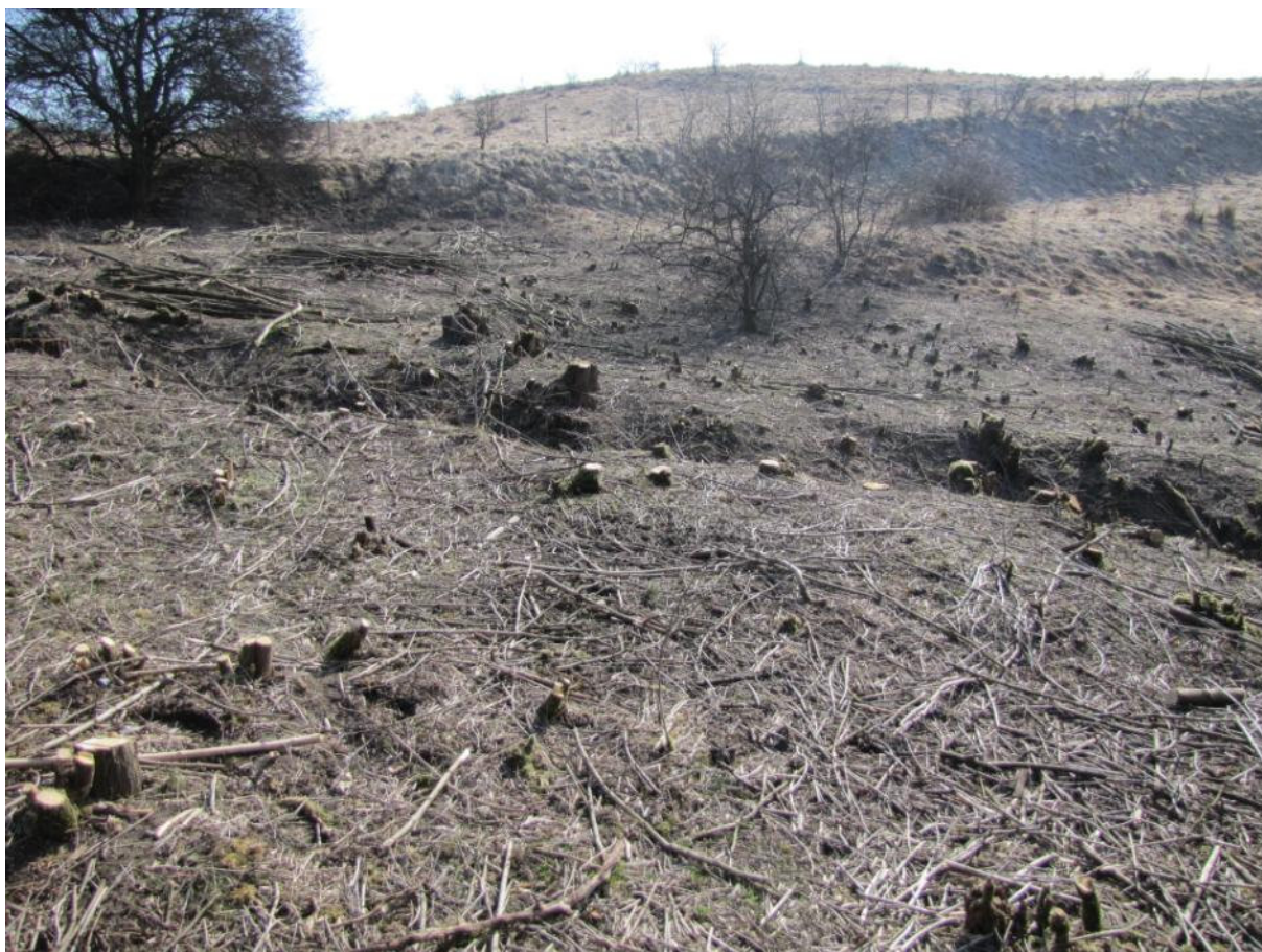
Powierzchnia przeznaczona do odtwarzania

Projekt i zakupy finansowane ze środków Narodowego Funduszu Ochrony Środowiska i Gospodarki Wodnej oraz unijnego instrumentu finansowania LIFE+