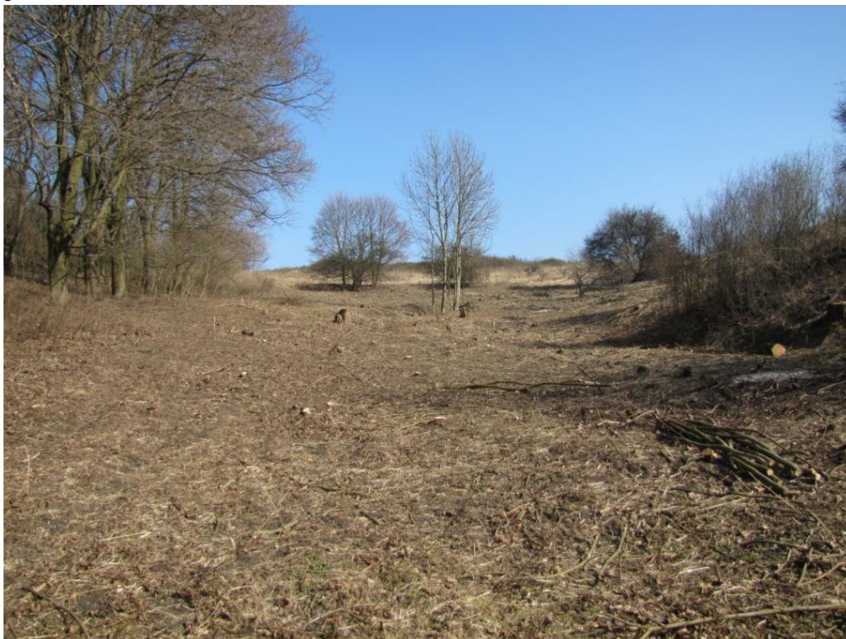
Powierzchnia przeznaczona do odtwarzania

Opis warunków terenowych: teren pochyły (ok. 0,6 ha) i częściowo skarpa (ok. 0,1 ha), podłoże piaszczysto-gliniaste.