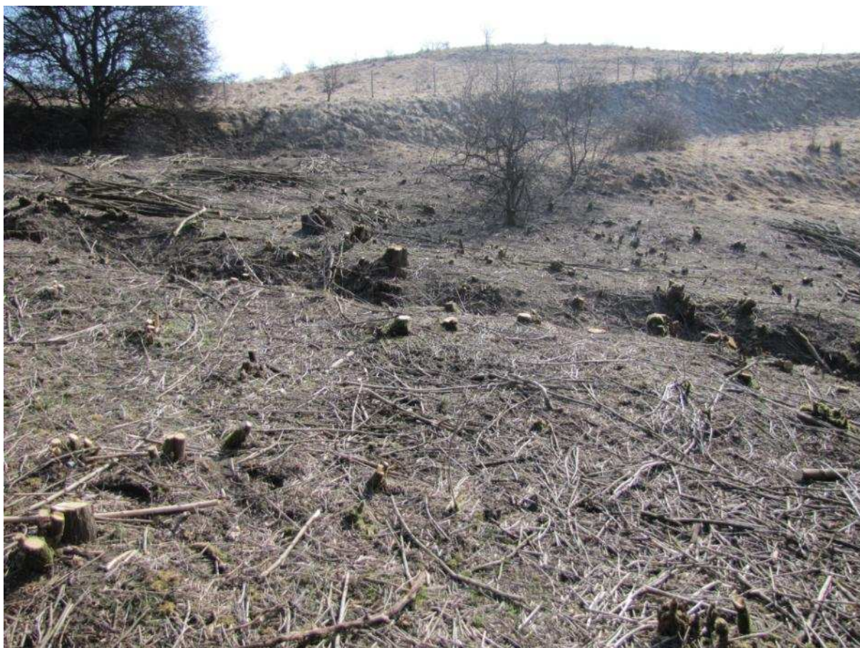
Powierzchnia przeznaczona do odtwarzania

Projekt i zakupy finansowane ze środków Narodowego Funduszu Ochrony Środowiska i Gospodarki Wodnej oraz unijnego instrumentu finansowania LIFE+