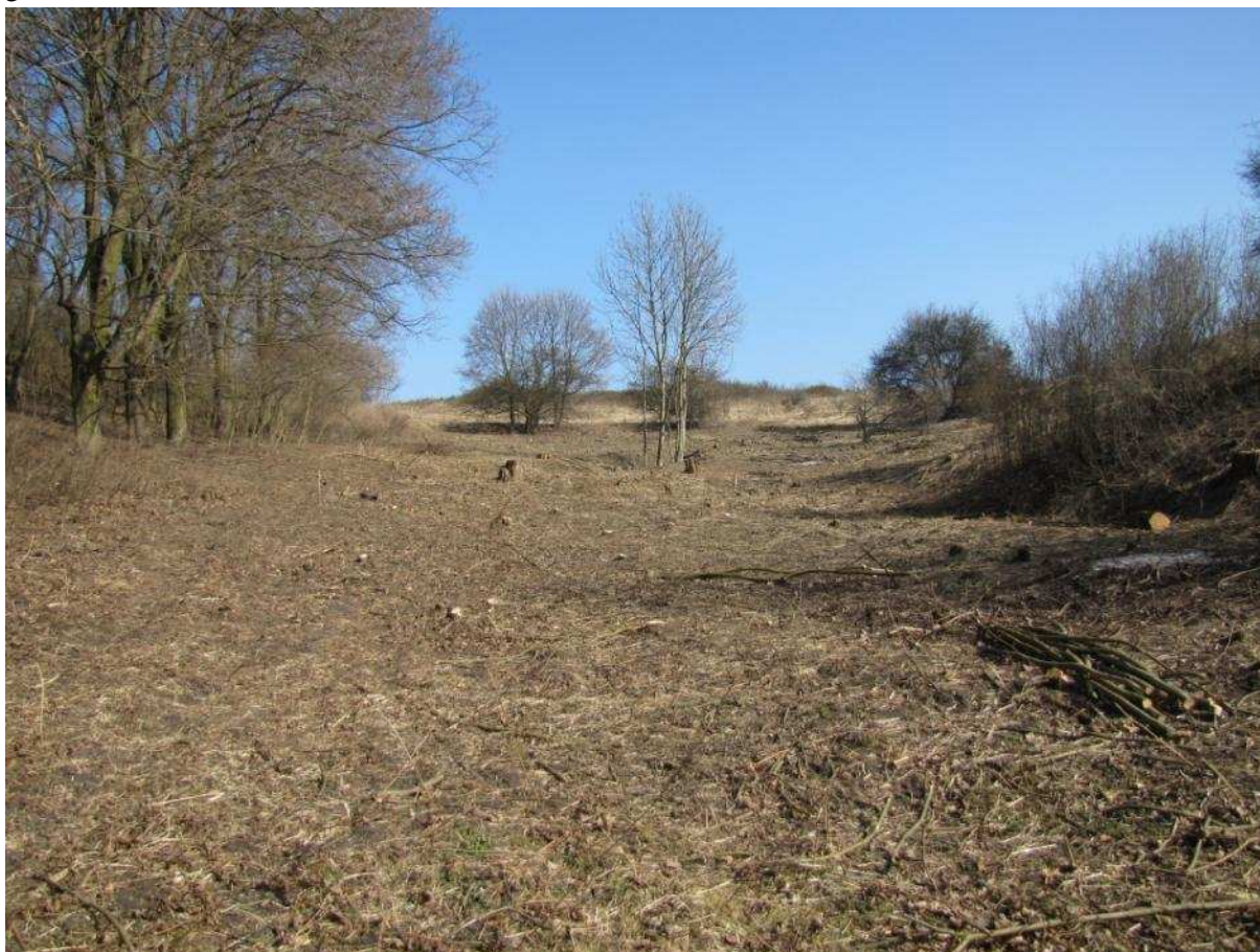
Powierzchnia przeznaczona do odtwarzania

Opis warunków terenowych: teren pochyły (ok. 0,6 ha) i częściowo skarpa (ok. 0,1 ha), podłoże piaszczysto-gliniaste.