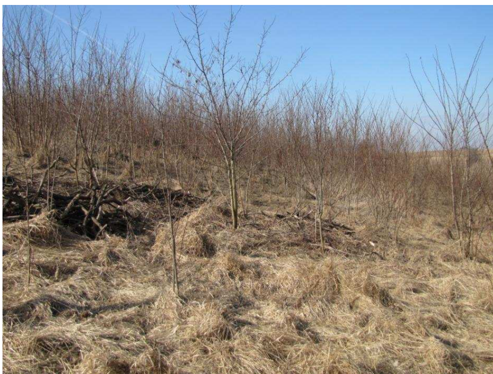
Powierzchnia przeznaczona do odtwarzania