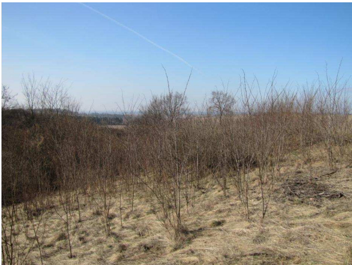
Powierzchnia przeznaczona do odtwarzania

Projekt i zakupy finansowane ze środków Narodowego Funduszu Ochrony Środowiska i Gospodarki Wodnej oraz unijnego instrumentu finansowania LIFE+