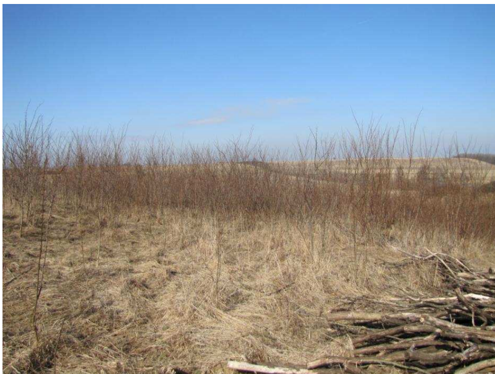
Powierzchnia przeznaczona do odtwarzania

Projekt i zakupy finansowane ze środków Narodowego Funduszu Ochrony Środowiska i Gospodarki Wodnej oraz unijnego instrumentu finansowania LIFE+