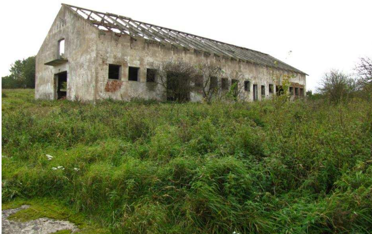
Powierzchnia przeznaczona do odtwarzania

Projekt i zakupy finansowane ze środków Narodowego Funduszu Ochrony Środowiska i Gospodarki Wodnej oraz unijnego instrumentu finansowania LIFE+