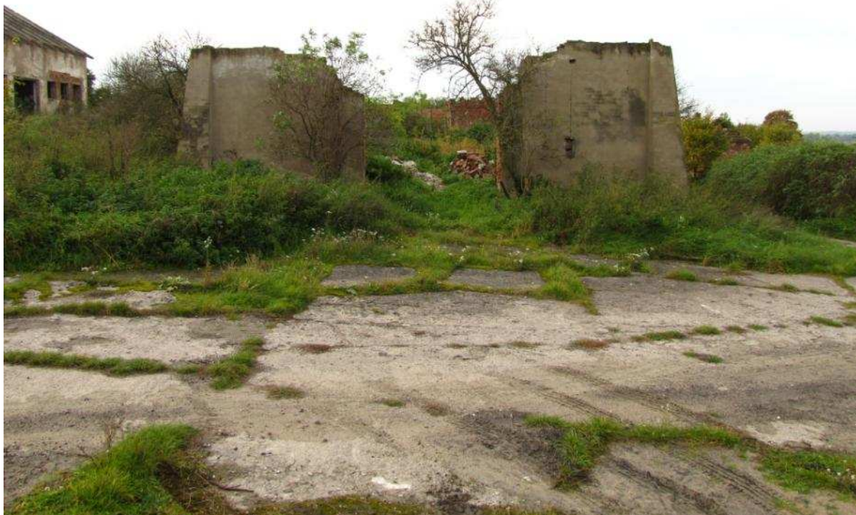
Powierzchnia przeznaczona do odtwarzania

Opis warunków terenowych : teren płaski lub lekko pochyły, podłoże piaszczysto-gliniaste.