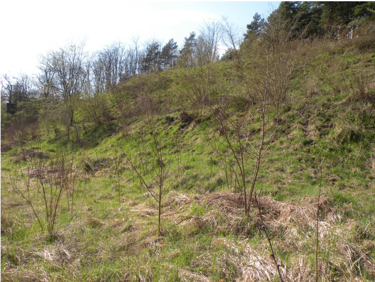
Powierzchnia przeznaczona do odtwarzania

TRUTWINIEC (RDLP Szczecin, nadleśnictwo Mieszkowice, leśnictwo Siekierki, pododdział 72 c) - odtwarzanie murawy kserotermicznej na powierzchni 0,3 ha poprzez zdarcie wierzchniej warstwy gleby na głębokość 0,4 m wraz z usunięciem pojedynczych drzew i krzewów oraz karp ściętych drzew i krzewów. Wycięcie samosiewu robinii akacjowej z terenu przyległego o powierzchni 0,2 ha (wiek drzewostanu – ok. 20 lat). Wyrównanie i uprzątnięcie powierzchni po zdarcie gleby i wyrwaniu karp. Przygotowanie i złożenie ściętego drewna w sortymencie wg zaleceń miejscowego leśniczego. Pozostały materiał pozyskany podczas prac (ścięte krzewy, karp, gałęzie, zdarta gleba, darń, ściółka itp.) należy wywieźć poza teren wykonywanych prac i zagospodarować we własnym zakresie. Za zagospodarowanie materiału odpowiada Zleceniobiorca. Opis warunków terenowych: teren położony na stromej skarpie (ok. 45°), podłoże piaszczysto-żwirowe.