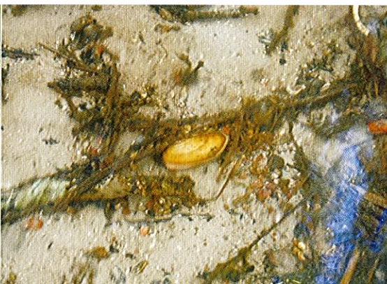
Fot. 12. Wody Kosy aż do Dębna odznaczają się dużą czystością.