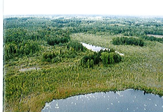
Fot. 1. Północna część obszaru to niezwykle kompleks bagien, szuwarów, łożowisk i lasów łęgowych zamieszkałych przez żółwie błotne.

Jest to nasz największy krajowy gryzoń, który po kilkuset latach nieobecności w środowisku powraca na tereny, gdzie niegdyś występował. W związku ze zmia-