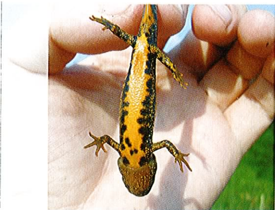
Fot. 21. Traszka grzebieniasta - cenny gatunek wymieniony w Dyrektywie Siedliskowej.