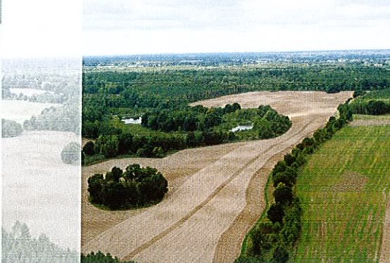
Fot. 7. Zróznicowany krajobraz to dodatkowy atut obszaru Natura 2000.