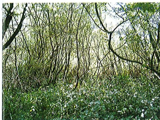
Fot. 3. Niedostępne łożowiska w północnej części obszaru.