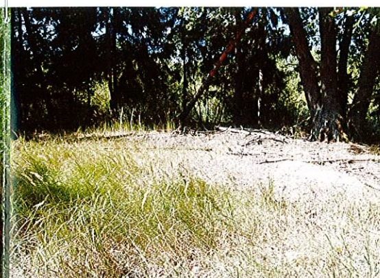
Fot. 15. W miejscach potencjalnych lęgów dla żółwi, Nadleśnictwo Mieszkowice prowadzi prace pielęgnacyjne.