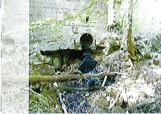
Fot. 19. Pozostałości dawnych młynów, jazów i przepustów stanowią poważne przeszkody w migracji wielu gatunków zwierząt.