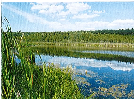
Fot. 5. Malownicze jezioro eutroficzne w początkowym odcinku Kosy.