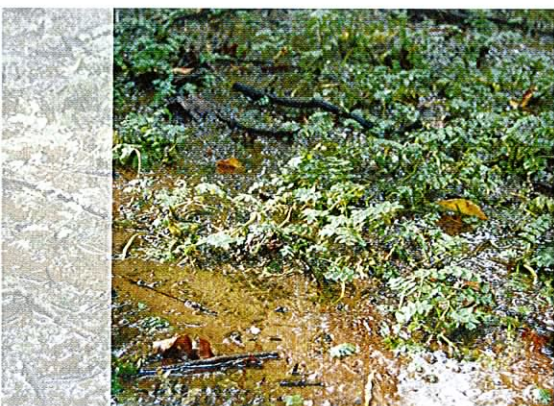
Fot. 9. Źródlika to jedno z cennych siedlisk dla ochrony których tworzy się obszary Natura 2000.