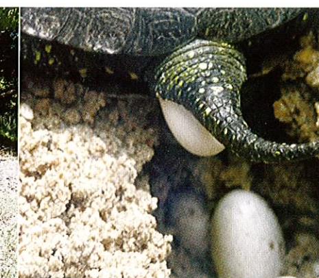
Fot. 16. Moment składania jaj.