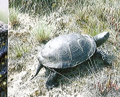
Fot. 14. Samice żółwi na przełomie maja i czerwca opuszczają zbiorniki wodne i szukają miejsca do złożenia jaj.