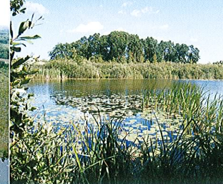
Fot. 2. Zbiornik wodny z bogatą roślinnością pływającą - siedlisko żółwia błotnego.