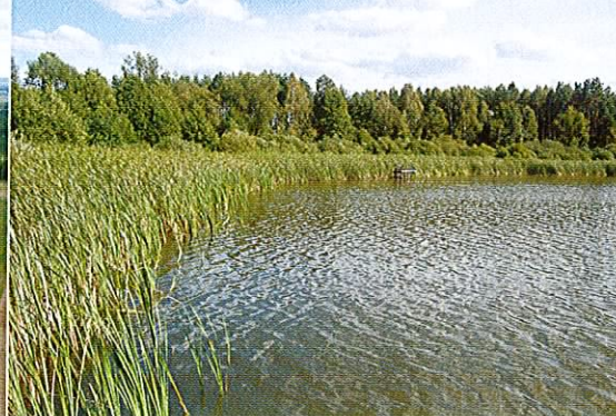
Fot. 8. Jezioro Warnickie z szerokim pasem roślinności szuwarowej.