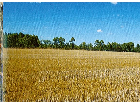
Fot. 17. W przypadku zaniku naturalnych lęgów, żółwie składają niekiedy jaja na polach czy drogach gruntowych.