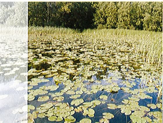
Fot. 23. Grzybnienie białe - gatunek chroniony, związany z eutroficznymi zbiornikami.