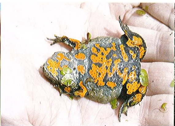
Fot. 22. Kumak nizinny posiada charakterystyczne, jaskrawe ubarwienie brzusznej strony ciała. Fot. M.M.