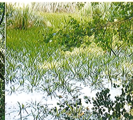
Fot. 4. Zbiorniki wodne zarastające osoką aloesowatą ulegają szybkiemu wypłyceniu.