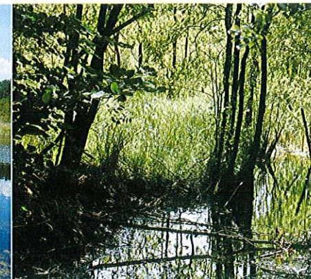
Fot. 6. Lasy łęgowe - cenne siedlisko przyrodnicze, zajmują 12% powierzchni obszaru.