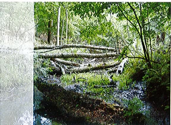
Fot. 11. Obecność drzew martwych warunkuje występowanie ginących, wąsko wyspecjalizowanych gatunków grzybów, roślin i zwierząt.