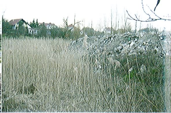
Fot. 20. W tym miejscu, w granicach Dębna, jeszcze kilkanaście lat temu żyło kilka osobników żółwia błotnego.