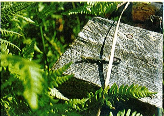
Fot. 24. Jaszczurka żyworódka - gatunek związany z terenami wilgotnymi i podmokłymi.

nami użytkowania terenu rodzi to szereg konfliktów. Budując tamy aktywnie przekształca środowisko dla własnych potrzeb, piętrząc wodę i przyczyniając się do jej retencji. Żyje w żeremiach lub norach. W wielu krajach Europy zachodniej wyginął lub jest bardzo rzadki. W Polsce dzięki prowadzonej reintrodukcji gatunek ten zaczął się szybko rozprzestrzeniać. Jego obecność można łatwo stwierdzić po charakterystycznych zgrzyzach nad brzegami.