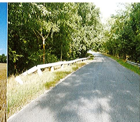
Fot. 18. Odcinek drogi Smolnica-Warnice to miejsce gdzie dochodzi do przypadków rozjeżdżania żółwi przez samochody.