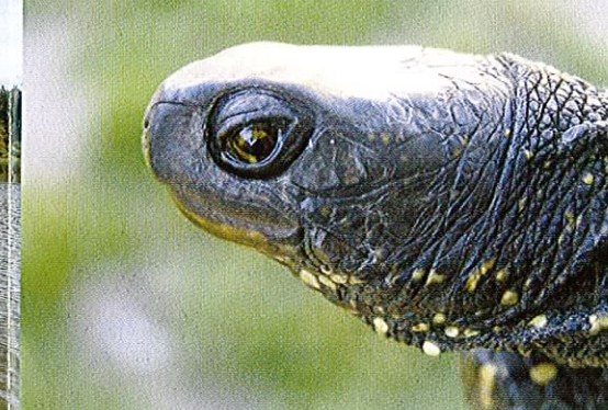
Fot. 13. Portret żółwia błotnego, gatunku ważnego dla zachowania bioróżnorodności Unii Europejskiej.