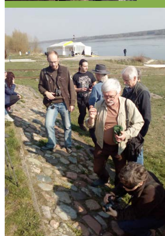
Spotkanie ze społecznością Trójmiasta w ramach opracowywanego przez Klub projektu planu ochrony Trójmiejskiego Parku Krajobrazowego.