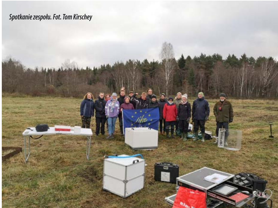
Spotkanie zespołu.

szu Life. Celem projektu jest zapewnienie trwałości działań ochronnych podejmowanych w ostojach Klubu poprzez rozbudowę infrastruktury technicznej służącej zagospodarowaniu uzyskiwanej biomasy w Stacji