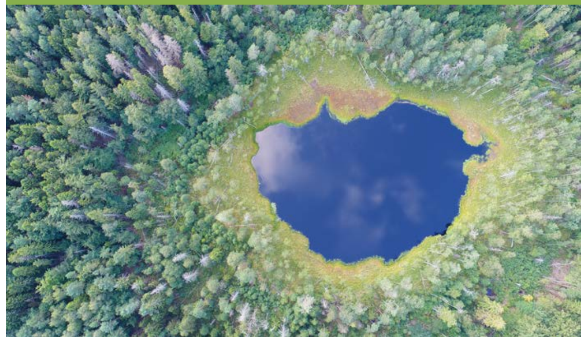
Zdjęcie z drona jeziora dystroficznego w rezerwacie Żurawie Chrusty wykonane w ramach prac nad planem ochrony.