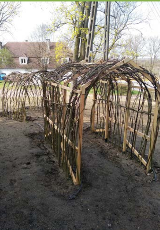
Wiklinowe, żywe tunele – pierwsze elementy ogródka dla dzieci przy Stacji Terenowej w Owczarach. Fot. K. Banaszak

Terenowej w Owczarach. W roku 2019 rozpoczęto opracowanie graficzne i merytoryczne 10 tablic informacyjno-edukacyjnych do Owczar, rozpoczęto prace projektowe na potrzeby budowy płyty obornikowej i kotłowni w Owczarach. Opracowano koncepcję aranżacji ogródka dla dzieci w Owczarach i rozpoczęto jej realizację. W ramach projektu dokonano pierwszych zakupów sprzętu technicznego na potrzeby zbioru i transportu biomasy z terenów objętych projektem.