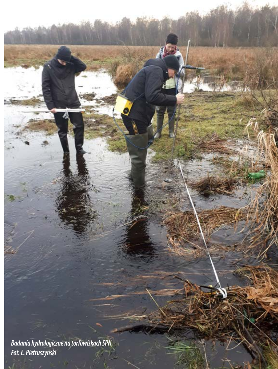
Badania hydrologiczne na torfowiskach SPN.