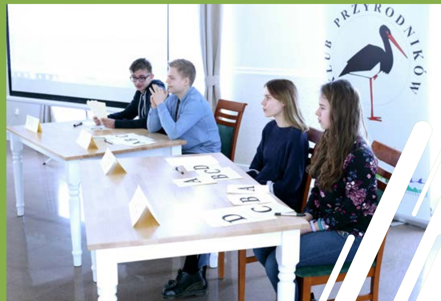
Uczniowie w trakcie półfinału Konkursu Przyrodniczego.

inwazyjne, zorganizowaliśmy konkurs na najbardziej ekologiczny i tradycyjny ogród wiejski w Uniemyślu i Okrzeszynie w formie „Dnia otwartych ogrodów wiejskich”, w którym wspólnie zwiedzaliśmy udostępnione przez mieszkańców wiejskie ogrody.