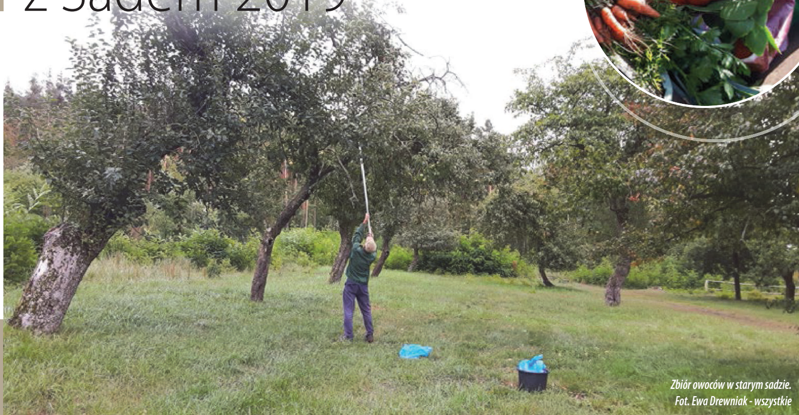
Zbiór owoców w starym sadzie.

Tak jak co roku, we wrześniu w Stacji Terenowej Klubu Przyrodników w Owczarach odbyło się Jesienne Spotkanie z Sadem. Imprezę organizujemy od kilkunastu lat, promując stare odmiany drzew owocowych. W Owczarach prowadzimy szkółkę drzewek, poszukujemy starych drzew, z których pobieramy zrazy i przeszczepiamy je na nowe podkładki. Uczymy też samodzielnego rozmnażania drzewek poprzez szczepienie, zachęcamy do ratowania w ten sposób odmian zwłaszcza starych, obumierających drzew (najbliższe warsztaty w marcu 2020).