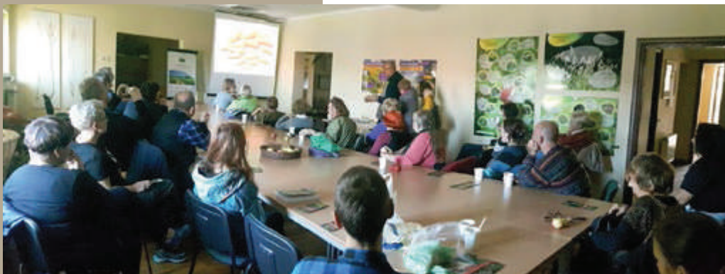
Wykład Anielskich Ogrodów