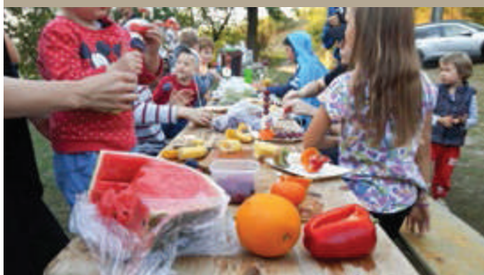
Warsztat o kształtach, smakach i zapachach owoców